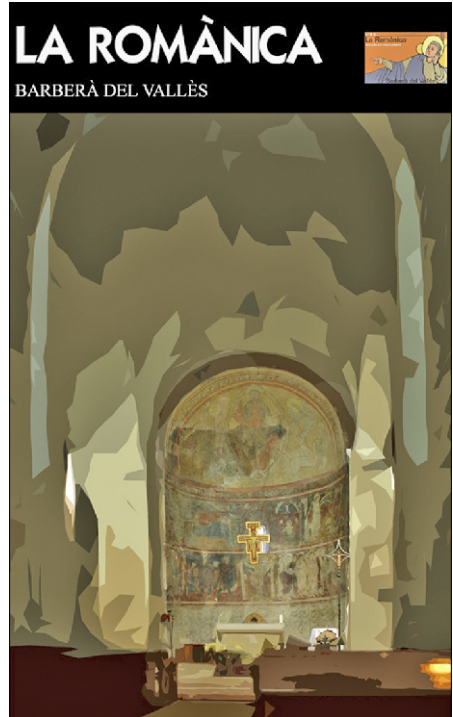
Figura 5. Pòster elaborat per alumnes de l'Institut La Romànica (Barberà del Vallès).

L'administració municipal resulta una altra beneficiària d'aquest projecte, dona-