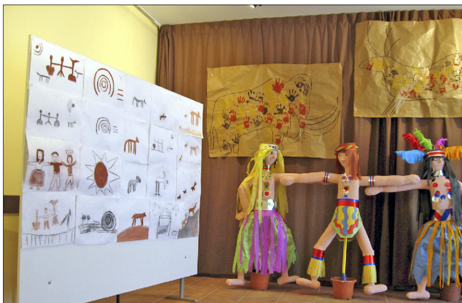
Figura 2. Exposició dels treballs realitzats per la ZER Montsec entorn les pintures de la cova dels Vilars (Os de Balaguer).

material, quan siguin capaços de produir emocions, és a dir, quan siguin capaços d'incidir en la sensibilitat de les persones d'aquella col·lectivitat on es troba. Aquest valor emotiu dels elements patrimonials dependrà en aquest cas tant del seu context sociocultural com de les circumstàncies de recepció d'aquests béns, entre elles, de manera prioritària, l'educació. Treballar des de l'acció educativa a escoles i instituts la percepció i la interpretació del passat comú permet aprendre tant el coneixement com les emocions envers el patrimoni comú, i això esdevé un objectiu prioritari que permet augmentar tant la capacitat d'entendre aquest passat des del present —i per tant entendre el present— com l'espectre d'emocions que generen en les persones aquests béns patrimonials.