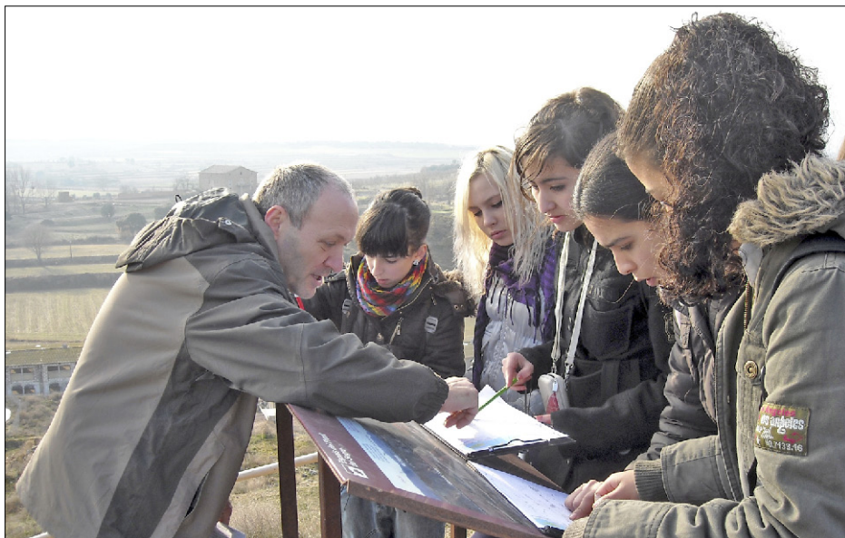
Figura 3. Visita d'un grup de 3r d'ESO de l'Institut Ciutat de Balaguer a l'espai musealitzat d'El Merengue (Camarasa).