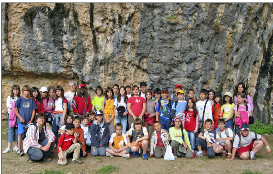
Figura 4. Visita d'un grup de Cicle Superior de l'Escola Gaspar de Portolà a la cova Gran de Santa Linya.