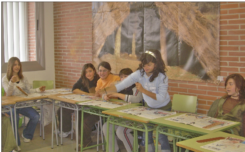
Figura 6. Taller d'arqueologia experimental amb alumnat de 1r d'ESO de l'Institut Sant Quirze (Sant Quirze del Vallès).